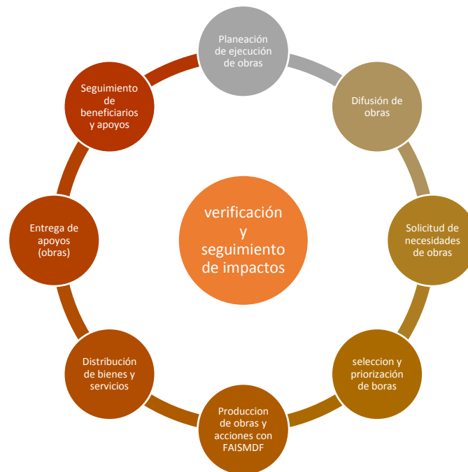
FIGURA 1. MODELO GENERAL DE PROCESOS SEGUIDOS

En consecuencia a lo anterior, el grado de consolidación operativa del FAISMDF, permite reconocer que 1) si existen documentos que normen los procesos del FAISMDF; 2) los operadores de los procesos están documentados respecto a la aplicabilidad del FAISMDF en obras –obras públicas municipales-; 3) los procesos están estandarizados respecto a la planeación de obras; 4) se cuenta con un sistema de monitoreo e indicadores de gestión que retroalimenten los procesos operativos por medio de sistemas de información aplicativos; 5) se cuenta con mecanismos para la implementación sistemática de mejoras. Por lo anterior, consolidación operativa del FAISMDF es de menor alcance comparado con el FAISMDF como otra fuente de financiamiento de obras para el Municipio y población objetivo identificable.